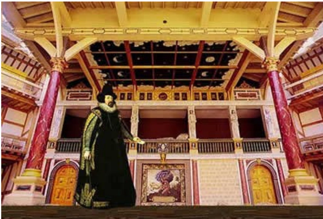
Sir Francis Bacon no Globe Theatre

... que se descubra outra maneira que seja conversível à Natureza dada, e que ainda seja a limitação de uma Natureza mais geral, à maneira de um verdadeiro gênero.[4]