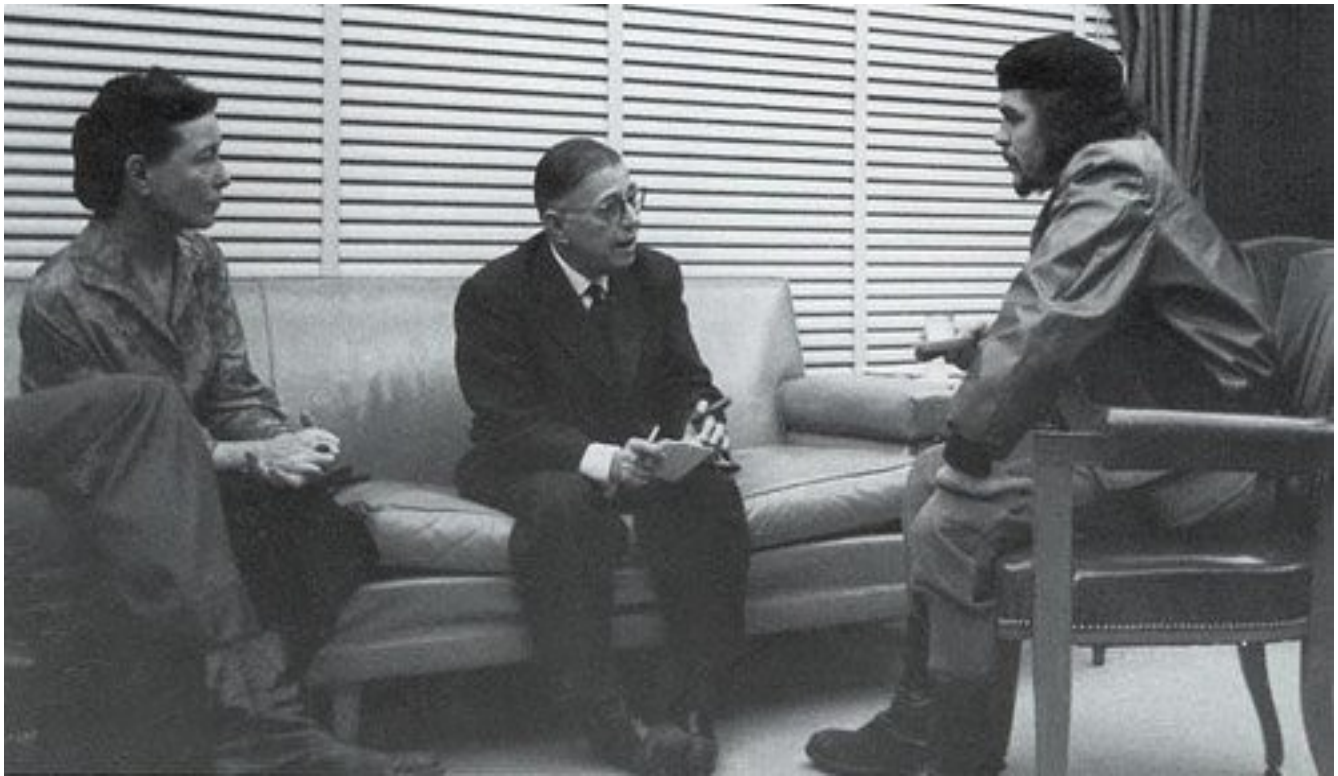
Beauvoir Sartre e Ché Guevara em Cuba (1960)

dizia que no caso humano (e só no caso humano) a existência precede a essência, pois o homem primeiro existe, depois se define, enquanto todas as outras coisas são o que são, sem se definir, e por isso sem ter uma "essência" posterior à existência. Baseado principalmente na fenomenologia de Husserl e em "Ser e Tempo", de Heidegger, o existencialismo sartriano procura explicar todos os aspectos da experiência humana. A maior parte deste projeto está sistematizada em seus dois grandes livros filosóficos: "O Ser e o Nada" e "Crítica da Razão Dialética". A mulher de Sartre, Simone de Beauvoir, cúmplice de seu pensamento, às vezes co-autora, às vezes contraditora, foi uma escritora, filósofa existencialista e feminista francesa. Escreveu romances, monografias sobre filosofia, política, sociedade, ensaios, biografias e uma autobiografia. Em seu primeiro romance, "A Convidada" (1943), explorou os dilemas existencialistas da liberdade, da ação e da responsabilidade individual, temas que abordou igualmente em romances posteriores como "O Sangue dos Outros" (1944) e "Os Mandarins" (1954), obra pela qual recebeu o Prêmio Goncourt e que é considerada a sua obra-prima. As teses existencialistas, segundo as quais cada pessoa é responsável por si própria, introduzem-se também em uma série de quatro obras