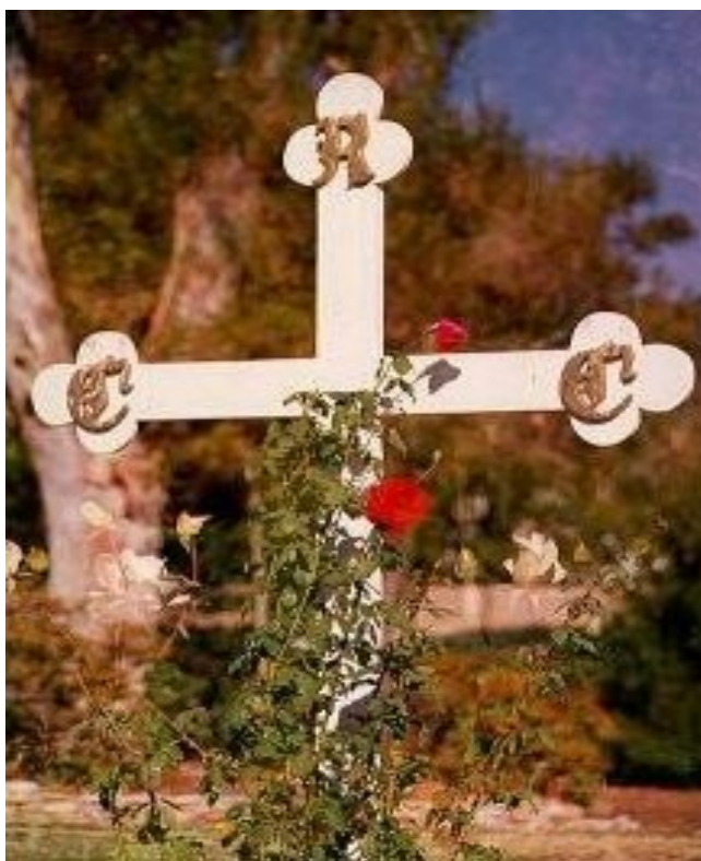
Túmulo Simbólico de CRC (na sede da The Rosicrucian Fellowship)