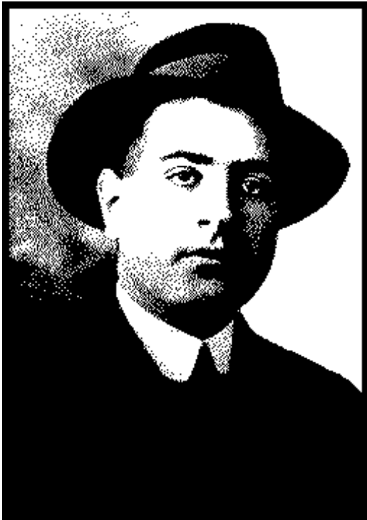
Mário de Sá-Carneiro

português, foi um dos grandes expoentes do Modernismo em Portugal e um dos mais reputados membros da Geração d'Orpheu.