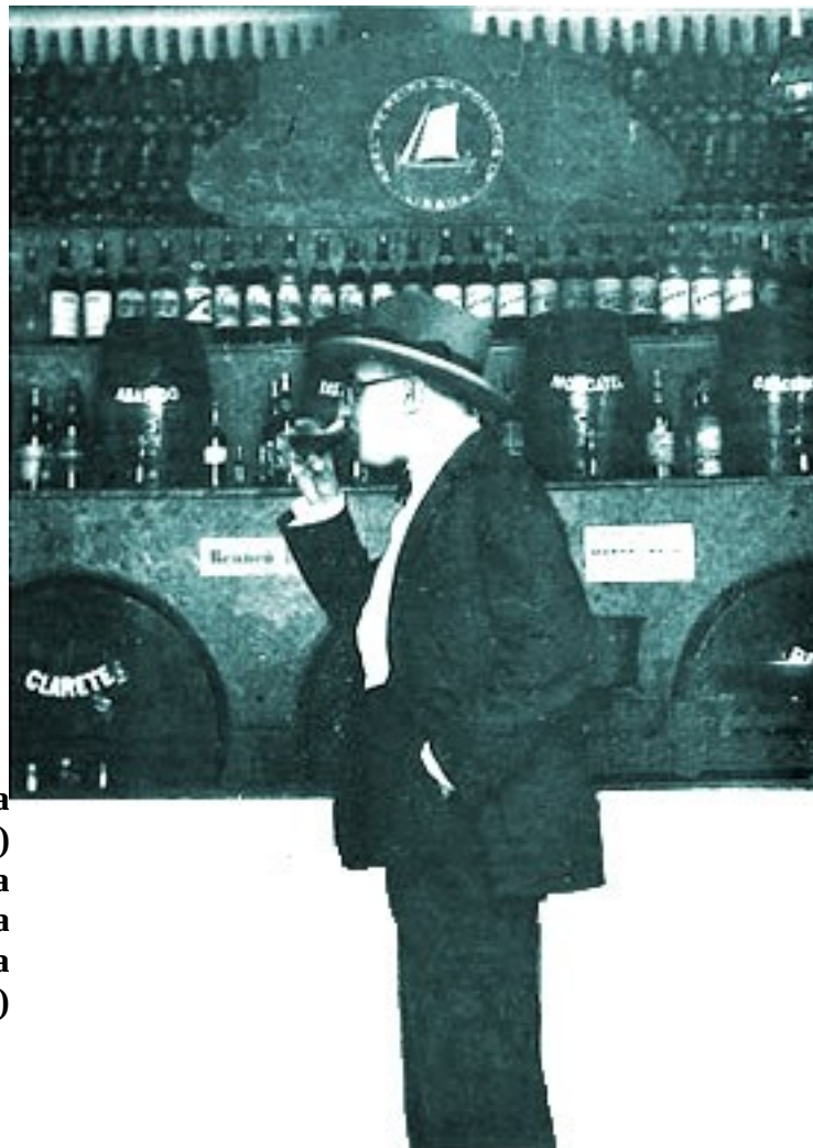
Fernando Pessoa (em flagrante delicto) Fotografia dedicada à Ophélia (no Abel Pereira da Fonseca, 1929)

1935: Em 29 de novembro, é internado com o diagnóstico de cólica hepática. Morre no dia 30. O assento de óbito de Pessoa indica como causa da morte bloqueio intestinal.