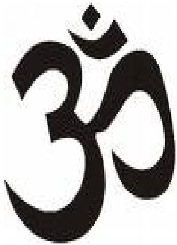
Símbolo do OM

Os estudos mostraram que a Força utiliza os Planos de Manifestação como um espelho, criando a matéria inanimada e a matéria animada como um reflexo que tem duração definida. Esse reflexo é projetado continuamente nos Planos de Compreensão, que são as dimensões esferoidais nas quais a Mente criada pelo movimento da Espiral da Força se instala. Desses Planos de Compreensão a mente devolve o reflexo como consciência total e consciência individual, criando a ilusão, para cada unidade autoconsciente, de que ela é o