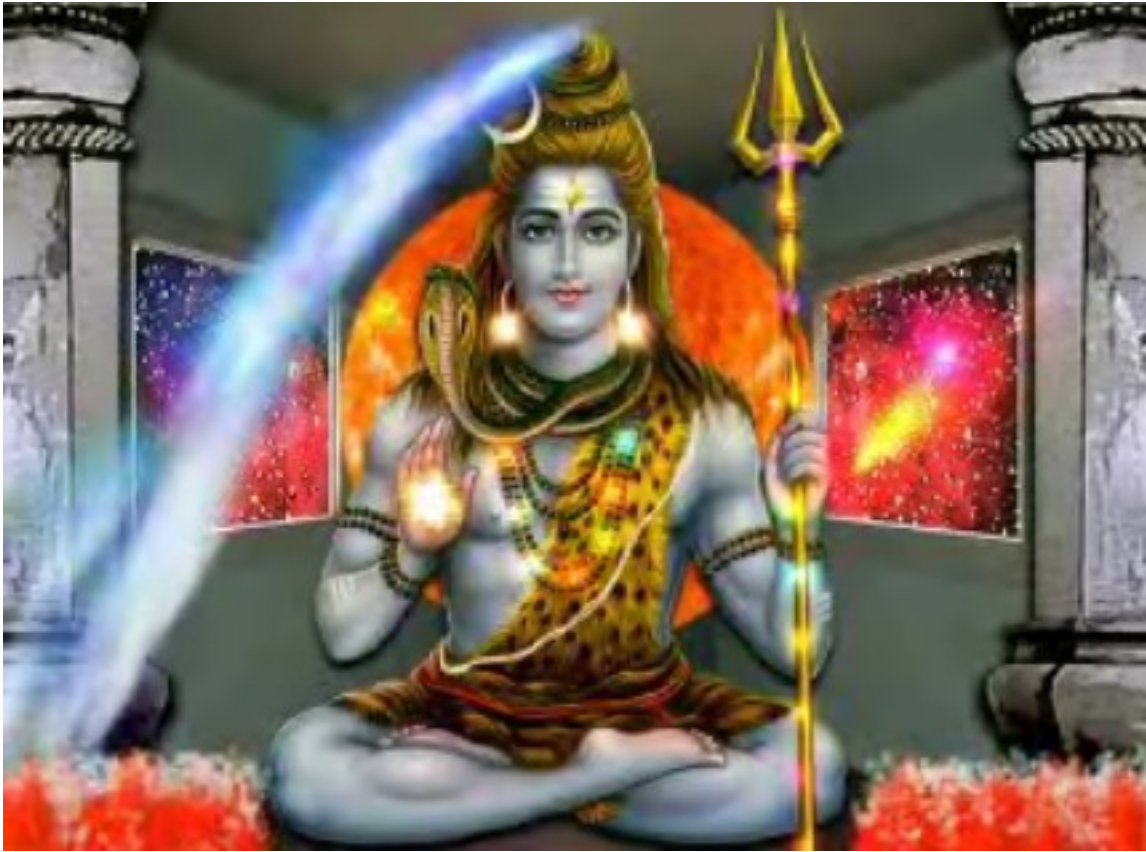
Shiva, o Transformador de Universos

Já como metamorfose produzida pela vontade de Seres Superiores provavelmente a mais conhecida é a da constante destruição e recriação dos Universos materiais e espirituais, sob o comando de Shiva, o Deus Hindu da Transformação. Shiva e sua esposa Kali operam a destruição do Todo Manifestado (Energia transformada em Matéria) gerado por Brahma (o Criador da Ilusão) e que Vishnu, Força de Equilíbrio, cuida de manter. Desta forma, a Trindade Divina Védica faz girar continuamente a Spira Legis, que roda também incessantemente o caleidoscópio da Transformação Universal. Essa concepção mental de Vyasa Deva, o maior filósofo Hindu, autor dos Vedas e divinizado, supera, sem comparação, as tacanhas concepções de Criação do mundo produzidas pelos semitas e que resultaram na Civilização Cristã Ocidental. Aos que se interessarem por Shiva recomenda-se a leitura da Monografia Pública Especial online “O Segredo dos Mantras”, em: http://svmmvmbonvm.org/mantraons.htm