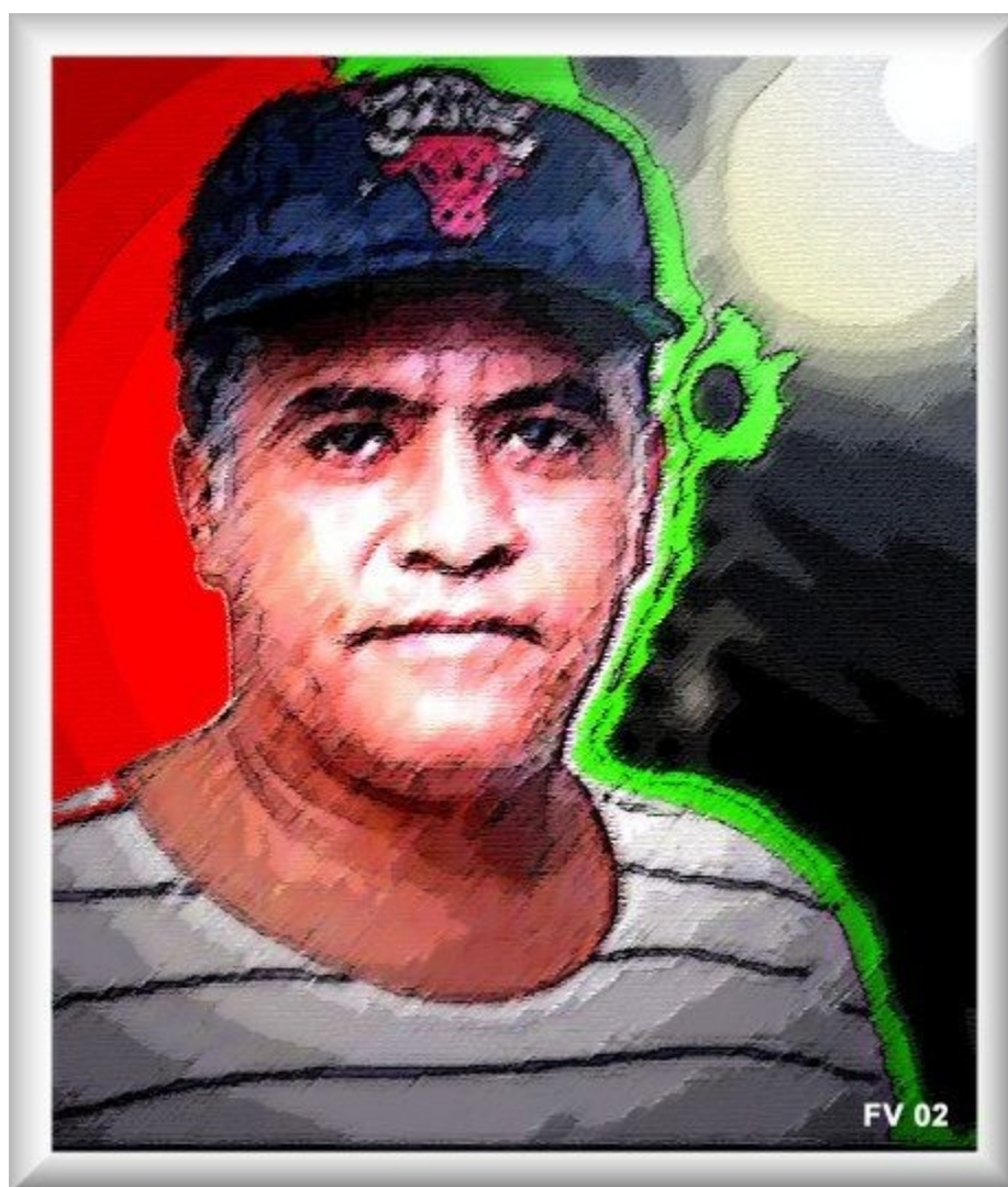
"Retrato de Tim Lopes" (Frater Velado, 2002CE)

além de ter sido simbólica foi um evento cujo significado social e místico jamais será apagado. Foi a mais brutal tentativa de silenciar a Imprensa já feita neste planeta pelo crime organizado, uma instituição que está, hoje, infiltrada em todos os escalões da sociedade. Assim, eu diria que a morte de Tim Lopes foi a consumação de sua existência neste plano com a sacralização de seus valores, cristalizados na autêntica imagem de um mártir moderno.