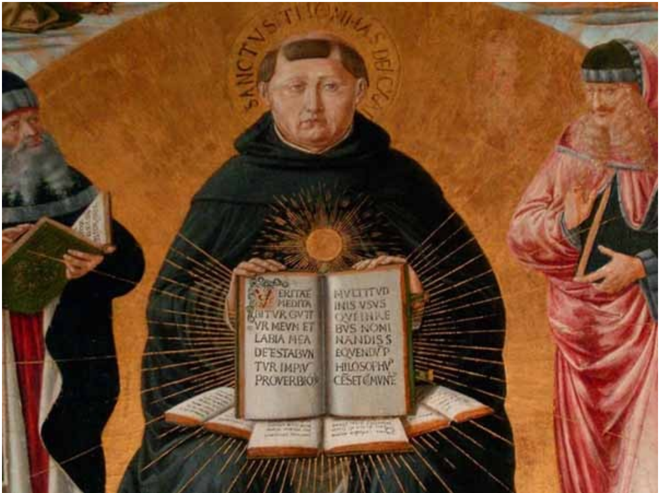
S. Tomás de Aquino e a Bíblia

proclamado santo pela Igreja Católica e cognominado de Doctor Communis ou Doctor Angelicus, e é considerado o mais sábio dos santos e o mais santo dos sábios.