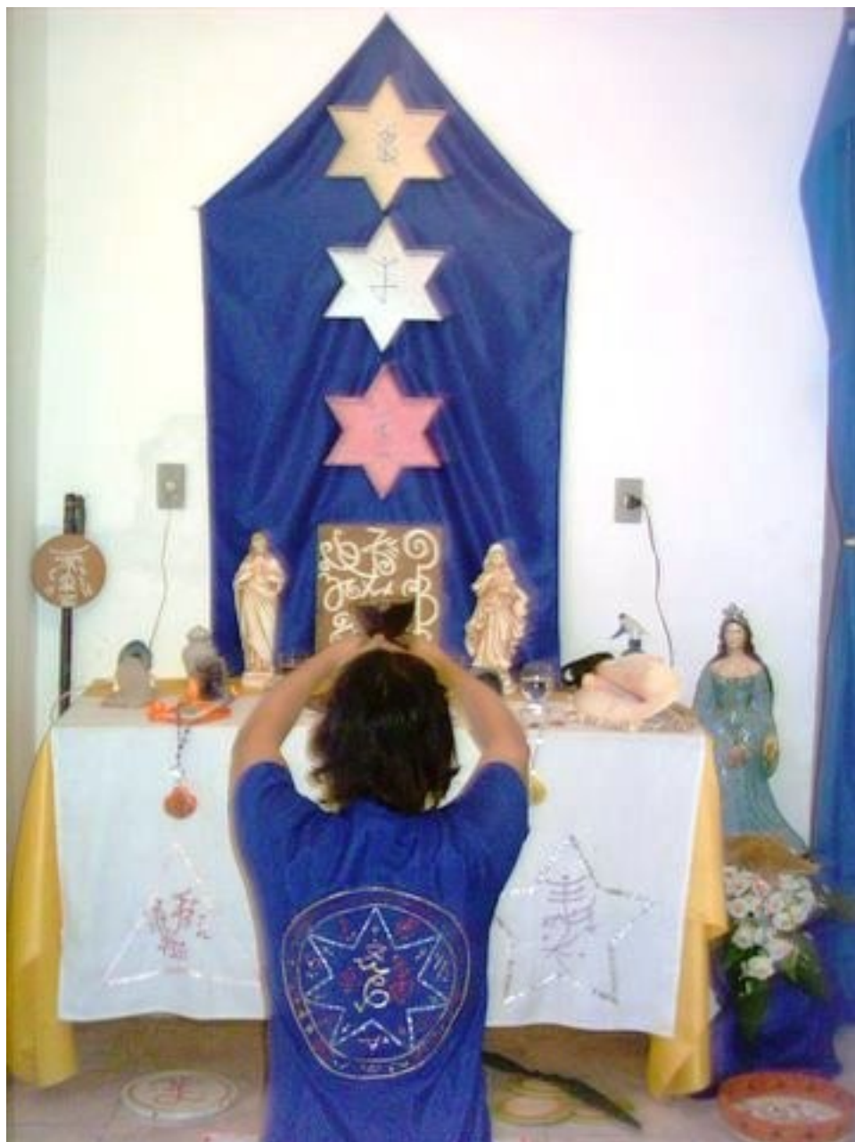
O autor oficiando ritual de Umbanda

C AROS amigos leitores, nossa obra retrata a verdadeira face da Umbanda, um movimento espiritualista iniciado em 1889 que objetiva unir, orientar e evoluir, os resquícios dos cultos afro-brasileiros, ameríndios e orientais, em nossa amada terra Brasil.