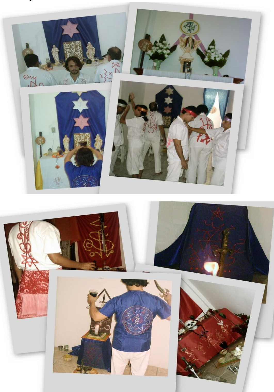
Rituais de Umbanda Esotérica

utilizar nesse banho apenas uma erva da vibração de Oxalá ou uma erva da vibração original (relacionada ao signo ) do médium que usará o banho.O autor em seu Templo Esotérico de Umbanda