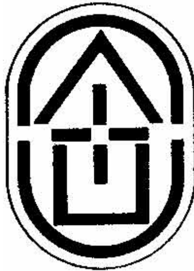
Emblema da FUDOSI

um certo sentido, ela segue iluminando invisivelmente os ideais Iniciáticos porque representou um momento iluminado e iluminante na história do esoterismo mundial. A FUDOSI exemplificou e demonstrou à sociedade a irmandade que sempre existiu na Terra entre as diversas fraternidades autênticas e comprovou durante o tempo em que esteve ativa que Omnia Ab Uno .